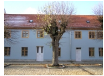
Sanierung Klosterstraße 5, 2004/2005