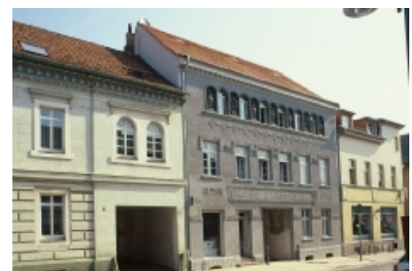
Sanierung Strausberger Straße 5, 2001-2003