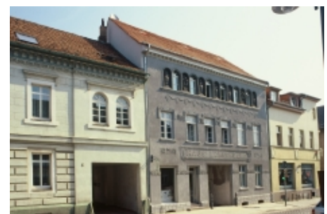
Sanierung Strausberger Straße 5, 2001-2003