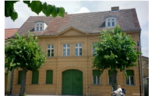
Sanierung Klosterstraße 12, 1993 - 1997